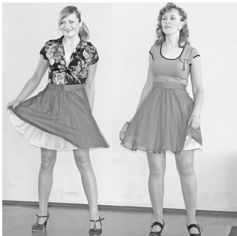
Дуэт «Созвездие» (Гульцовская школа).