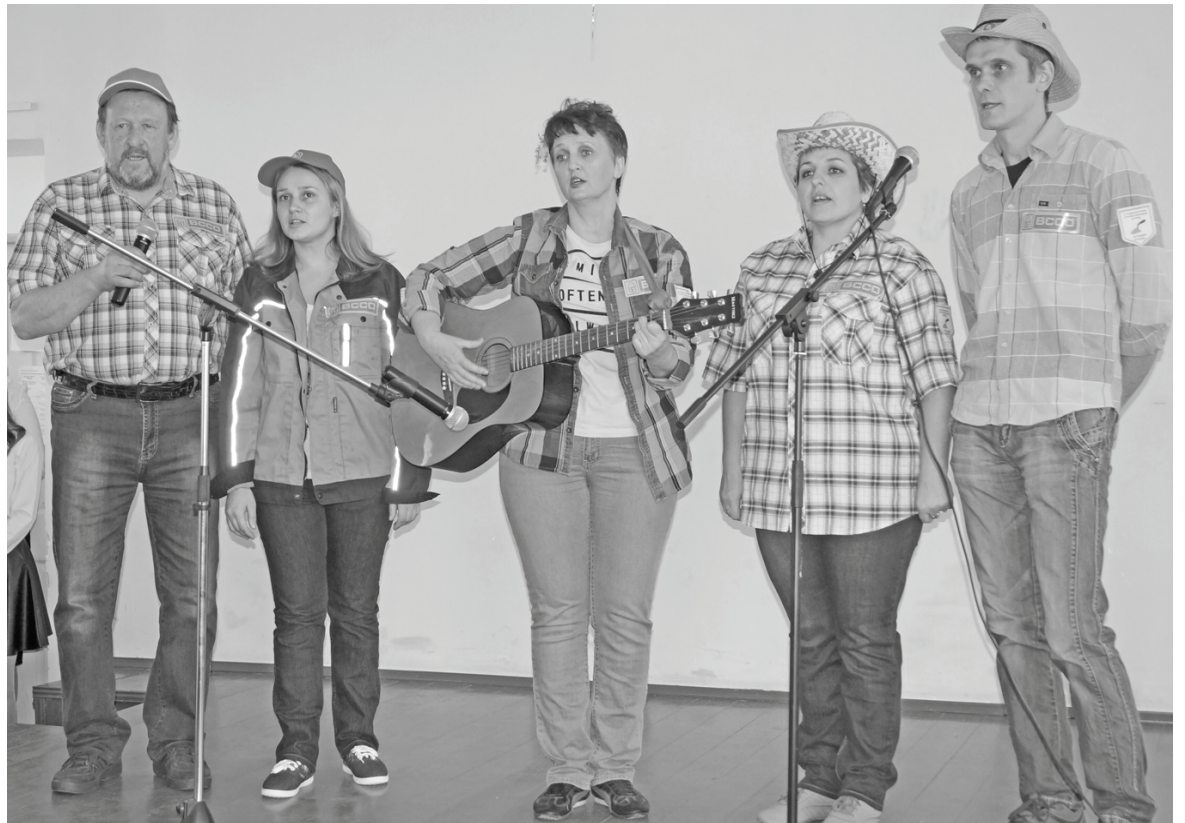
На сцене - брынский «Дирижабль».

К полудню в актовом зале яблоку было негде упасть: немало собралось и самих участников, еще больше людей пришло поболеть за коллег и наставников.